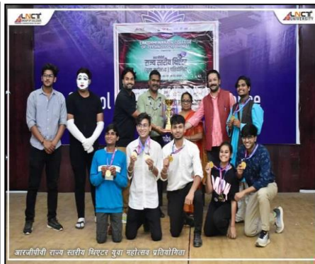
आरजीपीवी राज्य स्तरीय थिएटर युवा महोत्सव प्रतिस्पर्धा