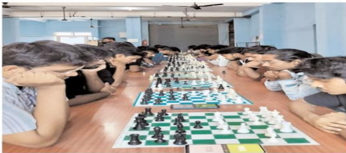
स्पोर्ट्स एज भोपाल

एलएनसीटी ग्रुप द्वारा एलएनसीटी कैम्पस रायसेन रोड भोपाल में आयोजित की जा रही 8th इंजीनियर्स ओलंपिक 2025 के तीसरे दिन खो-खो, शतरंज, वॉलीबॉल, रस्साकशी, बैडमिंटन, के फाइनल मुकाबले खेले गए। जिसमें