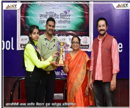
आरजीपीवी राज्य स्तरीय थिएटर युवा महोत्सव प्रतिस्पर्धा