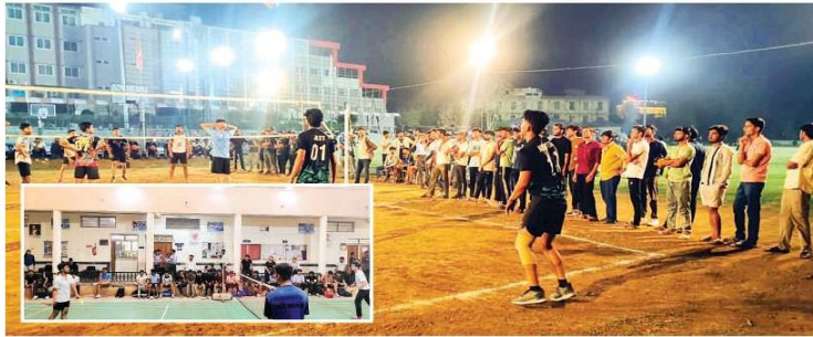
पहले दिन हुए ये मुकाबले

इस चार दिवसीय आयोजन में 16 खेलों का आयोजन किया जा रहा है। जिसमें वॉलीबॉल, कबड्डी, बास्केटबॉल, खो-खो, शतरंज, टेबल टेनिस, टेनिस बॉल क्रिकेट, गली क्रिकेट, चाइनीस चेकर, वॉटलिफ्टिंग, एथलेटिक्स, टा ऑफ बार, बैडमिंटन आर्म रेसलिंग ई स्पोर्ट्स इत्यादि खेल शामिल हैं। इन इवेंट में भोपाल के विभिन्न संस्थाओं के लगभग 3500 से अधिक खिलाड़ी हिस्सा लें रहे हैं।