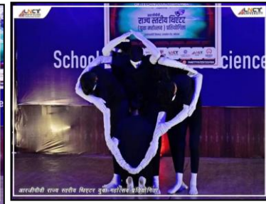
आरजीपीवी राज्य स्तरीय थिएटर युवा महोत्सव प्रतिस्पर्धा